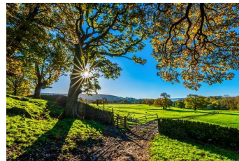
Der September lädt zum Wandern ein

Cornelia Lengwin , Tel. 05734 – 969095 (Der Hauskreis trifft sich 14-täglich am Dienstag-abend)