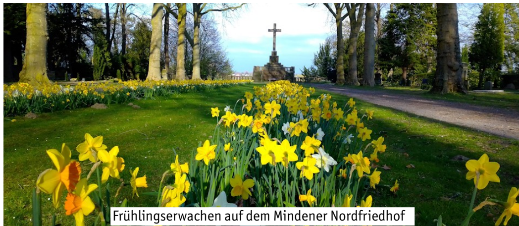
Frühlingserwachen auf dem Mindener Nordfriedhof