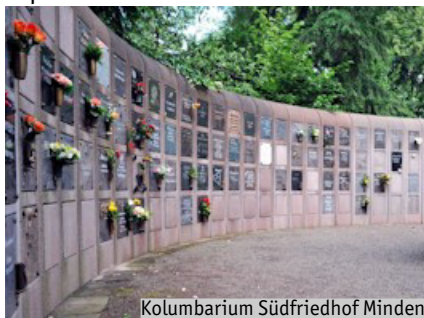
Kolumbarium Südfriedhof Minden

Die Beisetzung im Kolumbarium ist eine Form der Urnenbeisetzung, bei der die Asche eines Verstorbenen in einer Urne in einer Urnenwand – oft mit verschließbaren Kammern – aufbewahrt wird. Diese Urnenwände befinden sich meist an speziellen Standorten auf Friedhöfen, in Kirchen oder in eigens errichteten Gebäuden. Diese Form der Bestattung wird in Deutschland und anderen Ländern immer beliebter. insbesondere in städtischen Gebieten, da sie platzsparend ist.